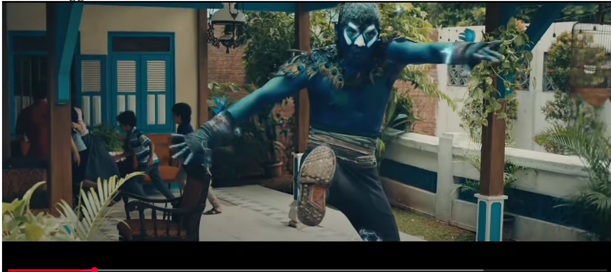
Gambar 3. Adegan Kelana Mengeluarkan Kekuatannya

Representasi tokoh singo barong dan kelana sewandana pada iklan ini berusaha menghidupkan kembali kesenian tradisional reog ponorogo yang selama ini identik dengan masyarakat jawa timur. dalam era modern yang serba digital, kesenian seperti Reog Ponorogo yang mulai tersingkirkan oleh hiburan yang lebih populer. Namun melalui iklan ini, budaya tersebut dimunculkan kembali dengan cara yang fresh dan estetik. Visualisasi topeng raksasa Singo Barong, bulu merak yang megah, serta gerakan tari yang gagah memberi pesan budaya tradisional bukan sesuatu yang kuno, tetapi memiliki keindahan yang patut dipertahankan dan dibanggakan.