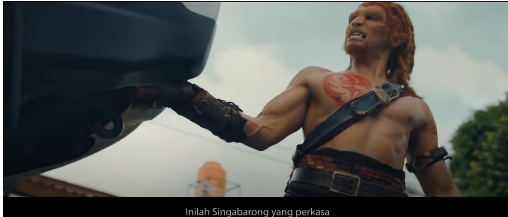
Gambar 1. Singo Barong

Dalam tayangan iklan tersebut mengandung tema kebudayaan lokal yang memperkuat simbol tokoh singo barong [dari kesenian reog ponorogo] dan tokoh kelana sebagai lawannya yang menampilkan dinamika konflik yang khas dalam seni pertunjukan tradisional. Sehingga kedua tokoh tersebut menjadi daya Tarik utama karena mempresentasikan warisan budaya jawa. Singo barong merupakan tokoh utama dalam seni reog ponorogo sebuah pertunjukan tradisional berasal dari jawa timur yang mana sosok singo barong ditampilkan dalam bentuk topeng raksasa berbulu harimau (barong). Kelana sewandana merupakan tokoh dalam cerita rakyat jawa yang juga menjadi bagian dari pertunjukan Reog Ponorogo. Kelana sewandana digambarkan sebagai seorang raja bangsawan dari kediri.